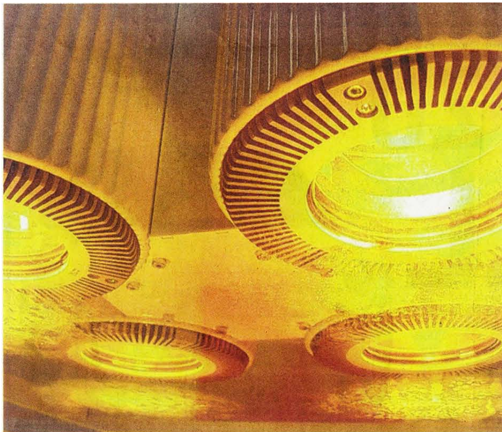
Futuristisch, aber nicht von einem anderen Planeten: „Hyperthermiestrahler“ nutzen mit dem tief eindringenden Infrarot die natürliche Wärmestrahlung der Sonne.